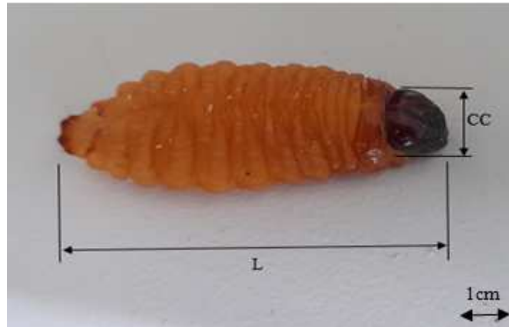
Figure 3. Mesures prises sur les différents stades larvaires du charançon rouge du palmier. (L) : longueur du corps, (CC) : largeur de capsule céphalique.

différentes larves étudiées. Ces données ont été également confirmées par la règle de Dyar qui suppose une croissance géométrique de la capsule céphalique. La longueur du corps (L) a été calculée de l'extrémité antérieure de la capsule céphalique jusqu'à l'extrémité postérieure du pygidium (Figure 3).