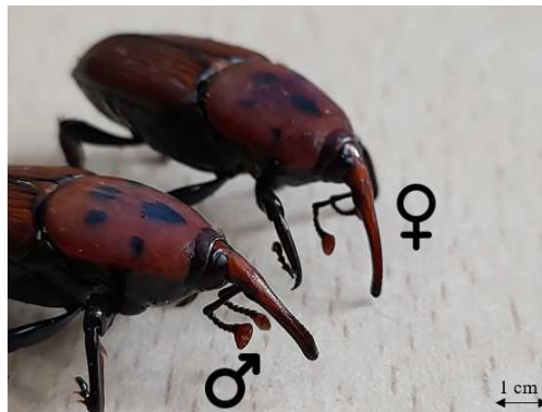
Figure 1 : Dimorphisme sexuel entre le mâle et la femelle du charançon rouge avec la présence de soies sur le rostre du male

Les adultes ( n = 73 ) ont été sexés en se basant sur la présence d'un tuf de poils fins sur l'extrémité dorsale du rostre chez les mâles et qui sont absents chez les femelles (Rochat et al. , 2017) (figure 1).