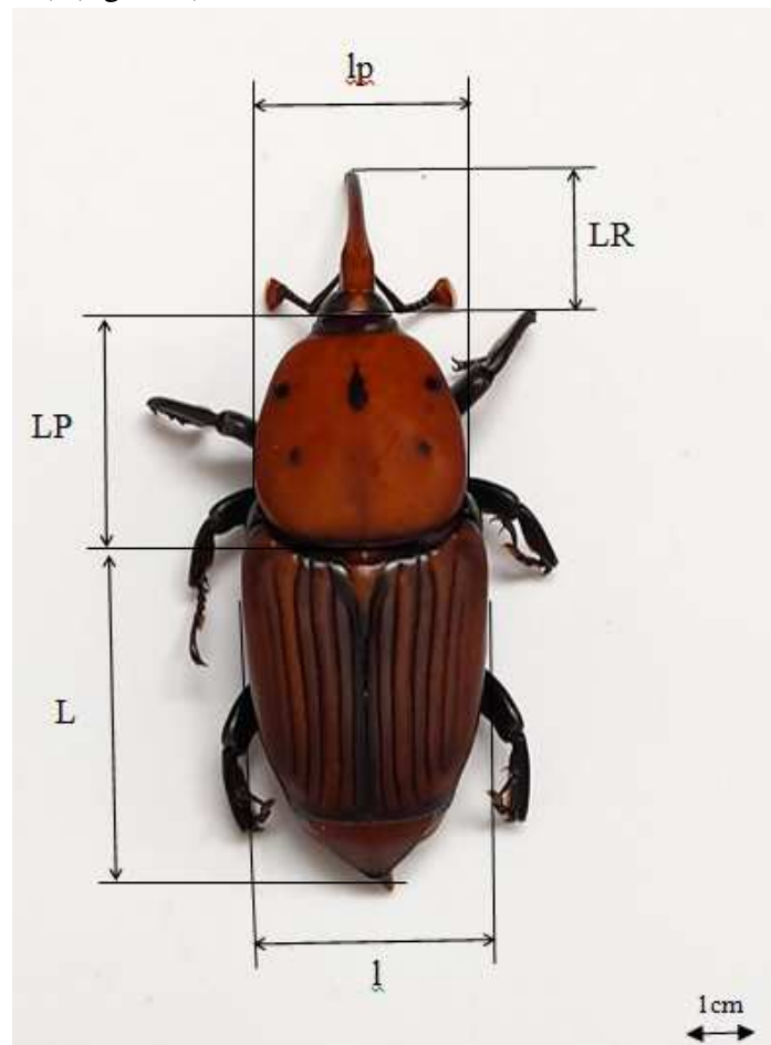
Figure 2 : Différentes mesures prises sur l'adulte du CRP (L : longueur du corps, l : largeur du corps, LP : longueur du pronotum, lp : largeur du pronotum, LR : longueur de rostre (LR))

Concernant les adultes, la longueur du corps (L) a été mesurée de l'extrémité antérieure du pronotum jusqu'à l'extrémité postérieure du pygidium tandis que la largeur du corps (l) a été mesurée de la base des élytres à leur point le plus large. La longueur du pronotum (LP) a été mesurée dorsalement du milieu de la base au milieu du bord apical ; et la largeur du pronotum (lp), au point le plus large du pronotum ainsi que la longueur de rostre (LR) selon le protocole de (Tambe et al. , 2013) (figure 2).